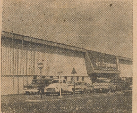
Esperanza Supermarket No. 2 Oranjestad